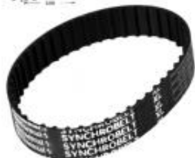
PAS KLINOWY XL