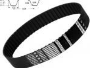
PAS ZĘBATY XL