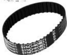
PAS KLINOWY XL