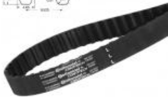
PAS ZĘBATY L