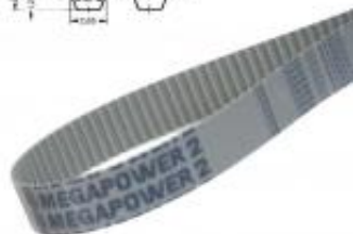
PAS ZĘBATY T5