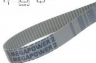
PAS ZĘBATY T5