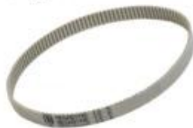
PAS ZĘBATY T2.5