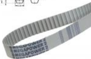
PAS ZĘBATY T10