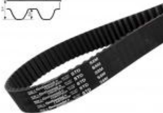
PAS ZĘBATY S8M