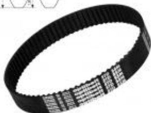
PAS ZĘBATY S5M