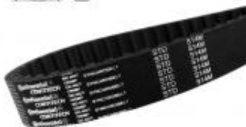
PAS ZĘBATY S14M