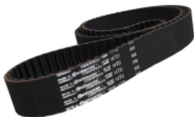
PAS ZĘBATY 8M