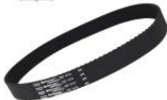
PAS ZĘBATY 5M