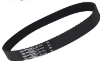
PAS ZĘBATY 5M