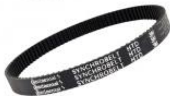
PAS ZĘBATY 3M