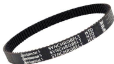
PAS ZĘBATY 3M