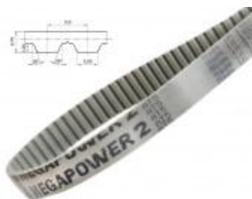
PAS ZĘBANY OTWARTY AT5