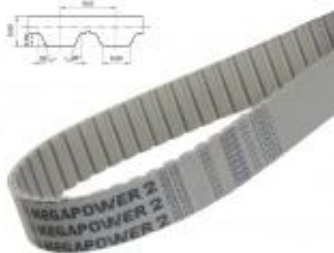
PAS ZĘBĄTY AT10 KV