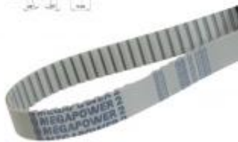
PAS ZĘBATY AT10