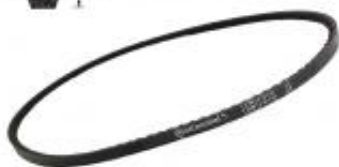
PAS KLINOWY UZĘBIONY ZX