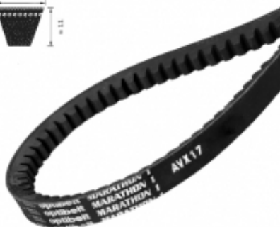
PAS KLINOWY UZĘBIONY AVX17