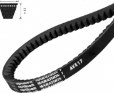
PAS KLINOWY UZĘBIONY AVX17