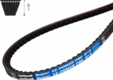
PAS KLINOWY UZĘBIONY 5VX