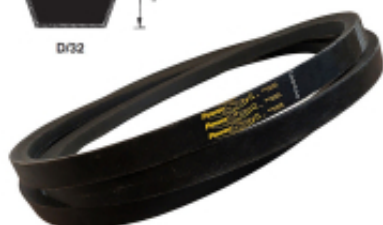
PAS KLINOWY D PowerSpan