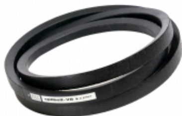
PAS KLINOWY C