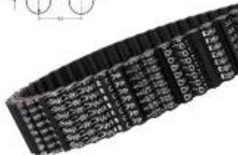
PAS OBUSTRONNIE ZĘBATE D8M CXP