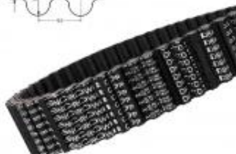
PAS OBUSTRONNIE ZĘBATE D8M CXP