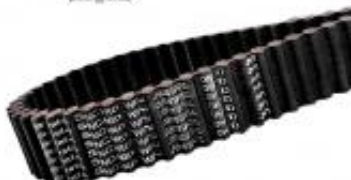
PAS OBUSTRONNIE ZĘBATE D8M