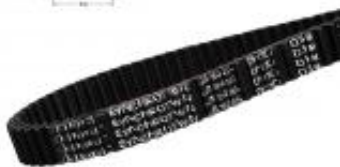
PAS OBUSTRONNIE ZĘBATY D5M